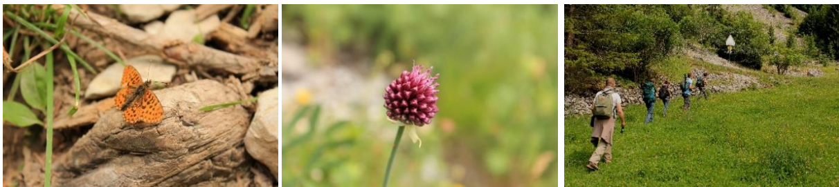
Eindrücke von der Wanderung zum Walopsee

Im Juli unternahmen wir gemeinsam mit Wanderfreunden und Naturliebhabern eine Tagestour ins Simmental. Beim Aufstieg zum Walopsee konnten wir mehrere Gruppen Gänsegeier und zwei Schlangenadler beobachten. Auch zeigten sich die erhoffte Aspispiper und die Waldeidechse. Uns faszinierten aber auch die verschiedenen Orchideen, Schmetterlinge wie der Apollofalter und die Simmentaler-Rinder. Die längere Wanderung und die Zugfahrt war eine ideale Gelegenheit um sich näher kennenzulernen und sich über Naturerlebnisse auszutauschen.