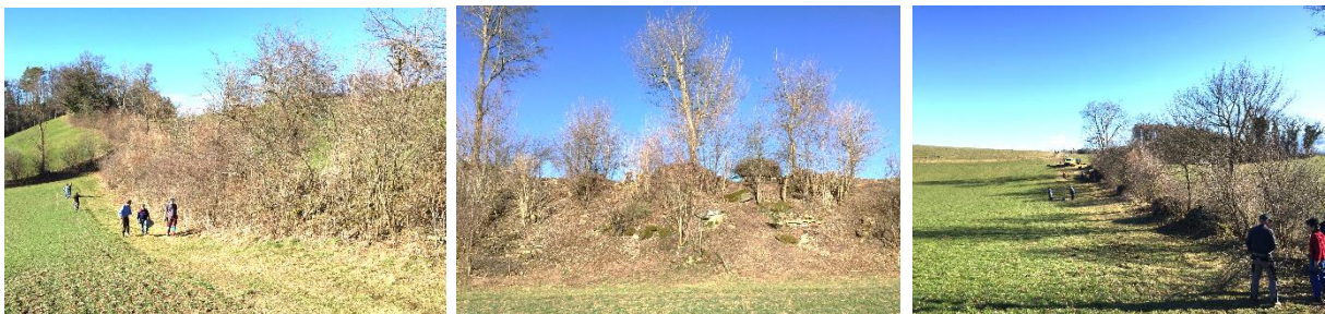
Einsatz auf dem Belpberg im März 2019

Am 16. März unterstützte faunaberna den Natur- und Vogelschutzverein Muri-Gümligen-Rüfenacht (MuGüRü) zusammen mit dem WWF Bern bei der Aufwertung und Verjüngung einer wunderschönen alten Hecke auf dem Belpberg. Wir jäteten Brennnesseln, schnitten diverse Sträucher zurück und bauten Ast- und Steinhaufen für Hermelin und Zauneidechse.