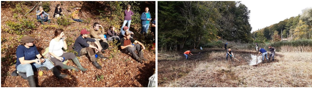
Das Arbeiten im Schilf erwies sich als sehr anstrengend

Am 26. Oktober war Nationaler Heckentag und wir wieder im Einsatz. An diesem Tag pflegten wir eine alte Hecke auf dem Belpberg in Zusammenarbeit mit dem Naturpark Gantrisch. Diese wunderschöne Hecke war seit Jahren nicht mehr gepflegt worden, birgt jedoch viel Potential. Wir konnten an diesem Tag zusammen mit vielen Mitgliedern und - sehr erfreulich - einigen neuen Gesichter ungefähr 80 Meter dieser Hecke aufwerten. Dazu gehörten folgende Eingriffe: Übermässig vorhandene Sträucher und Bäume (Esche, Feldahorn und Hasel) wurden dezimiert; besonders wertvollen Sträuchern wurde Platz geschaffen (Weissdorn, Wildrosen, Pfaffenhütchen, Schwarzdorn und Stachelbeere); es wurden einige zusätzliche Sträucher gepflanzt zur Erhöhung der Artenvielfalt; es wurden zwei Steinhaufen mit Brutkammer für Hermelin und Co. angelegt; zu guter Letzt wurden noch zwei wirklich sehr grosse Asthaufen mit diversen Unterschlüpfen erstellt.