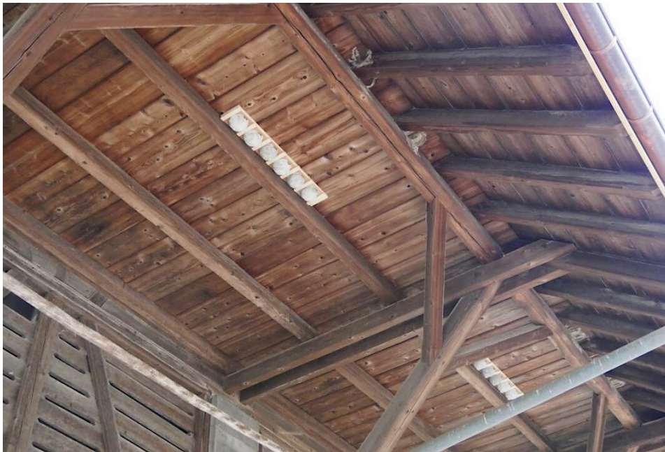
Diese Nisthilfen wurden von einigen Mehlschwalben angenommen

Mehlschwalben sehr Standorttreu sind, benötigten wir eine Nistmöglichkeit in der Nachbarschaft. Nach Absprache mit den Besitzern konnten wir an einem benachbarten Pferdestall Nisthilfen platzieren, und zudem erhielten wir die Möglichkeit, an einem weiteren Bauernhof in der Nähe Nisthilfen aufzuhängen. Angesichts der schwindelerregenden Höhe kam uns dabei grosszügig die Feuerwehr Belp zu Hilfe. Mindestens 4 von 12 Nestern an einem dieser Bauernhöfe sind mittlerweile besetzt und zwei weitere natürliche Nester haben die Mehlschwalben direkt neben den Nisthilfen erbaut. Es war sehr schön, diesen prompten Erfolg erleben zu können.