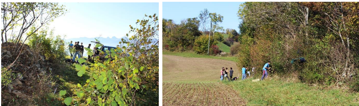
Beim Pflegen einer alten Hecke auf dem Belpberg

Am 26. Oktober war Nationaler Heckentag und wir wieder im Einsatz. An diesem Tag pflegten wir eine alte Hecke auf dem Belpberg in Zusammenarbeit mit dem Naturpark Gantrisch. Diese wunderschöne Hecke war seit Jahren nicht mehr gepflegt worden, birgt jedoch viel Potential. Wir konnten an diesem Tag zusammen mit vielen Mitgliedern und - sehr erfreulich - einigen neuen Gesichter ungefähr 80 Meter dieser Hecke aufwerten. Dazu gehörten folgende Eingriffe: Übermässig vorhandene Sträucher und Bäume (Esche, Feldahorn und Hasel) wurden dezimiert; besonders wertvollen Sträuchern wurde Platz geschaffen (Weissdorn, Wildrosen, Pfaffenhütchen, Schwarzdorn und Stachelbeere); es wurden einige zusätzliche Sträucher gepflanzt zur Erhöhung der Artenvielfalt; es wurden zwei Steinhaufen mit Brutkammer für Hermelin und Co. angelegt; zu guter Letzt wurden noch zwei wirklich sehr grosse Asthaufen mit diversen Unterschlüpfen erstellt.