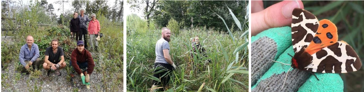
Freiwillige im Kampf gegen die Goldrute im Selhofenzopfen. Rechts: der Braune Bär

Kanadische Goldruten (Neophyten) im Naturschutzgebiet zu jäten. Am ersten Termin gab es leider relativ wenig Anmeldungen, beim zweiten Mal kam jedoch eine ordentliche Truppe zusammen und es war ein radikales Ankämpfen gegen die Goldruten möglich. Neben der Arbeit versüssten uns die Beobachtungen von Wasserralle und Braunem Bär ( Arctia caja ) den Tag.