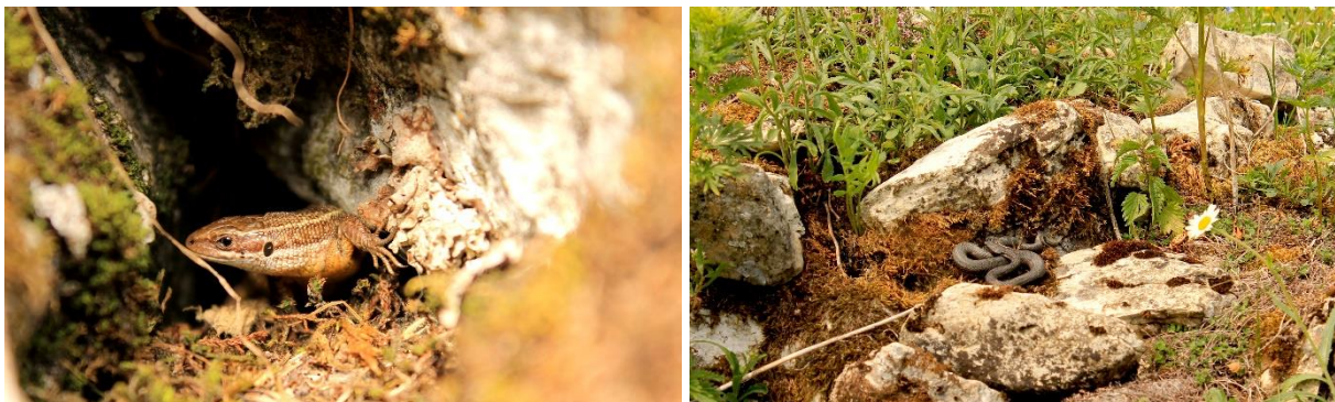
Es zeigten sich Reptilien wie Waldeidechse und Aspispiper

Bei der zweitägigen Exkursion in den Aletschwald wollten wir die eindruckliche Hirschbrunft im wunderschönen Arvenwald oberhalb des Aletschgletschers beobachten. Hierfür biwakierten wir bei frostigen Temperaturen außerhalb des Naturschutzgebietes auf ca. 2100m. Bereits beim Abendessen konnten wir die ersten Hirsche im Tal hören. Auch zeigten sich unweit unseres Biwaks balzende Birkhähne und zwei Gämsen. Am nächsten Morgen wanderten wir noch vor Sonnenaufgang in den Aletschwald. Dabei konnten wir die eindruckliche Hirschbrunft aus nächster Nähe hören und sehen.