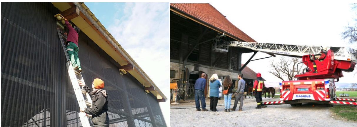
Nisthilfen für die Mehlschwalben wurden mit Hilfe der Feuerwehr angebracht

An zwei Samstagen im Sommer, dem 20. Juli und dem 17. August, waren wir einmal mehr im Naturschutzgebiet Selhofenzopfen in Kehrsatz tätig. Wir unterstützten dabei die Umweltgruppe Kehrsatz in ihrem Bestreben,