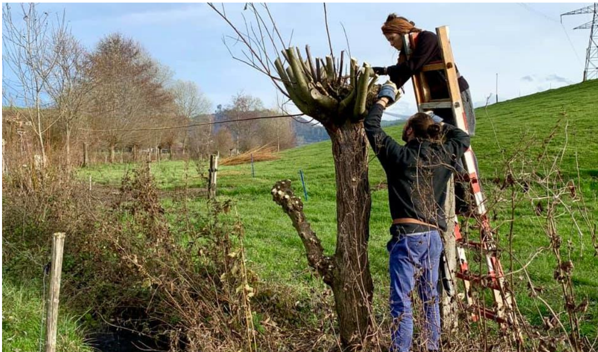
Das korrekte Schneiden von Kopfweiden will gelernt sein